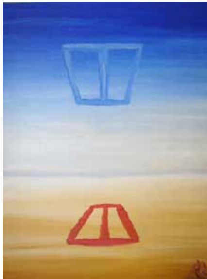
Окно в небеса

Вечер. Июль. Сорок три. Бой часов. На Сент-Сонго снова легла тишина. Скоро уйдет дым трубы, крыш пожар. Все ослепнет, останется лишь глаз окна.