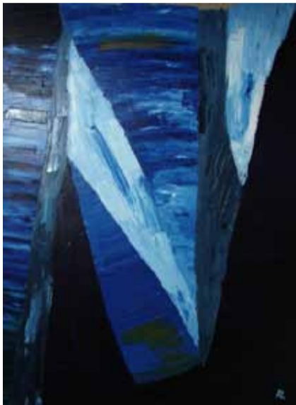
Берлинская лазурная симфония. Часть 1. Яхта у причала.