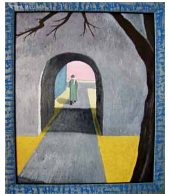
Уйду, чтобы вернуться. Страстная пятница.

Зима вернулась в этот город, Не оборвав ветвей, легла Покорной сукой возле горок Земли могильной. Без тепла,